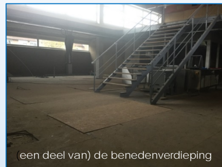
(een deel van) de benedenverdieping