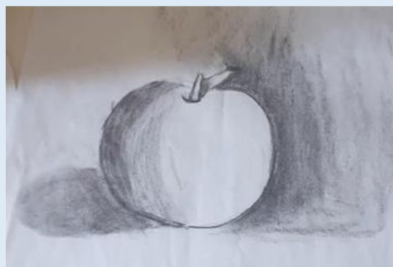
Shar on Voor sluijs Hle