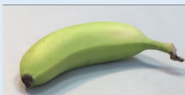
Abigail de Vlieger Hld