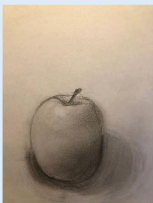
Faith Hamete Hle